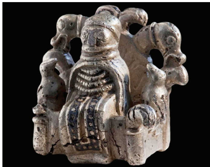
Odin figuren fra Gl. Lejre

Konen, der lavede udesidning for Håkon Hårdebredds fostermoder havde, hvad end hun skal opfattes som samisk eller norrøn, et nordisk navn. Tordis – guden Tors kvindelige fylgje/ånd. Uanset om Tordis var en virkelig person eller opfundet for at sværte Håkons parti i borgerkrigen, henviser navnet til den populære myte om guden Tor, der må klæde sig i brudekjole og holde bryllup med Turse-drotten Trym. Det er ikke bare endnu en myte, der viser nordiske guder med køsoverskridende adfærd. Det er en myte, der afmonterer forestillingen om begrebet ”ergi”. Trymskvadets budskab er, at selv den stærkeste kan blive magtesløs og løsningen er ikke at dø med støvlerne på, sådan som den enfoldige macho mand, der er bange for at være