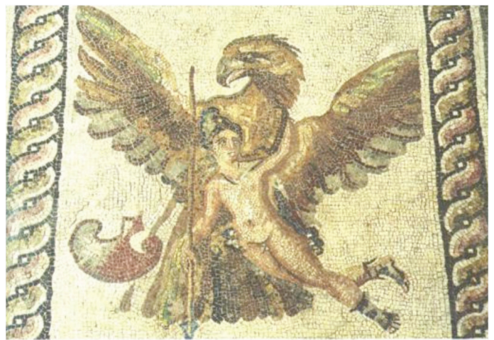
Zeus bortføre Ganymedes

Den græske drengeskærlighed satte sig også spor i den græske mytologi. Flere af de græske guder har deres egne eromenos. Fks er der en fortælling om Zeus, der i skikkelse af en ørn bortfører drengen Ganymedes. Også den homeriske helt Achilles har en mandlig elsker ved navn Patroklos. I historien om den trojanske krig, bliver drabet på Patroklos årsagen til, at Achilles genoptager kampen ved Troja, som han ellers havde trukket sig ud af. Historien skal nok ses som et billede på det kriger-ideal, der gjaldt i Sparta og Theben.