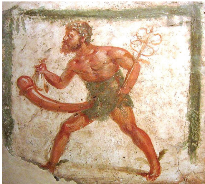
Mercur (Fresco fra Pompeii)

frihed end i andre: De spartanske kvinder var således berygtede, fordi de måtte dyrke sport og lære musik og dans, ting, som en pæn atheniensisk kvinde var fuldstændig afskåret fra. Vi har sange, netop fra det syvende århundredes Sparta komponeret for pige- og drengekor, der er fulde af flirt pigerne imellem. Endnu, 800 år efter, kunne Plutarch bemærke, at det var almindeligt, at fornemme spartanske kvinder havde forhold til unge piger.