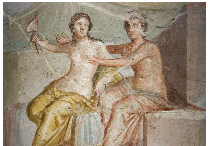
Lesbisk fresco fra Pompeii

De klassiske kilder fortæller ikke meget om kærlighed mellem kvinder, men disse kilder har i forvejen en kønsmæssig slagside. Den lesbiske kærlighed har sit navn efter øen Lesbos. Der boede en kvinde ved navn Sapphos, der nok var den hellenske verdens fremmeste kvindelige digter. Sapphos elskede både mænd og piger, og de småstumper, vi har tilbage af hendes diktning, viser, at hendes kærlighed til piger ikke kun var sjælelig. I visse græske byer havde kvinderne større