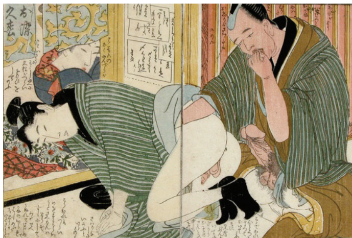
Samkønnet sex i Tokugawa tidens Japan.

sig nemlig, at seksualitet ikke udelukkende er noget, der tjener til forplantningen. Det tjener både til socialisering og magtdemonstration, for ikke at tale om adspredelse - at man gør det, fordi det er sjovt og dejligt. Nyere sammenfatninger af videnskabelige data, dokumenterer, at seksualitet, rettet mod eget køn, er et ret almindeligt udbredt fænomen i dyreriget. Det drejer sig ikke bare om tilfældig seksuel kontakt, men i mange tilfælde om par-dannelse, som varer livet ud. Hos mere end 1500 arter er samkønnet sex nu dokumenteret.