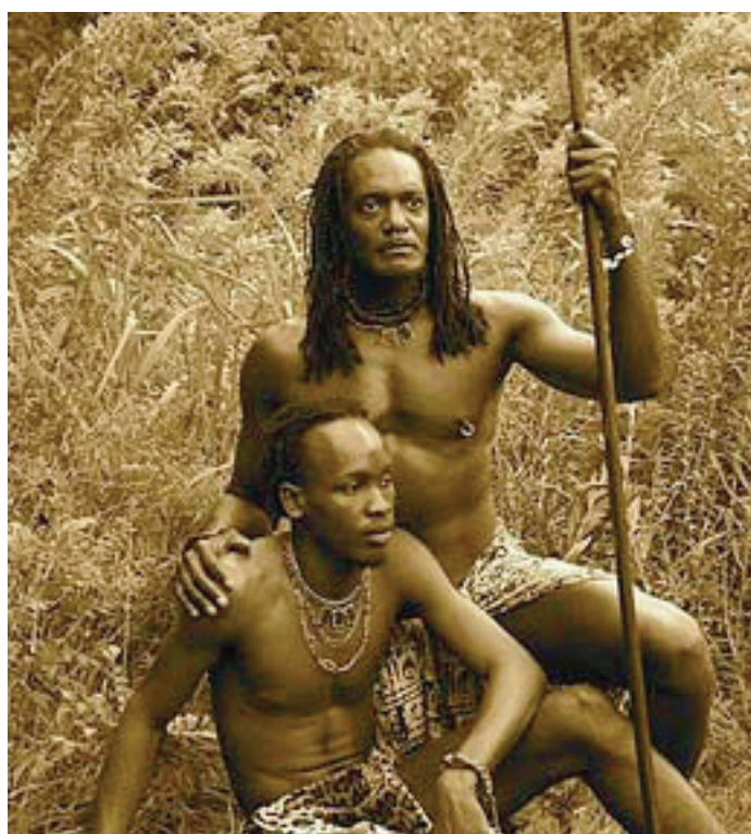
Krigerer med sin "boy-wife" fra Sudan (ca år 1900)

Efter antropologer fra slutningen af 1800 tallet og frem begyndte, at rejse rundt til alle verdensdele og beskrev de derværende kulturer, har man opdaget, at samkønnet sex ikke bare var en dille, de havde fundet på i det gamle Grækenland. Det viser sig, at være et udbredt fænomen i alle kulturer. Mange steder har det taget former som minder om den klassiske oldtid.